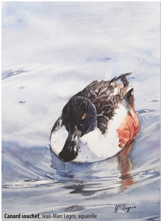
Canard souchet, Jean-Marc Legris, aquarelle

Une exposition de Jean-Marc Legris Aquarelles et acryliques